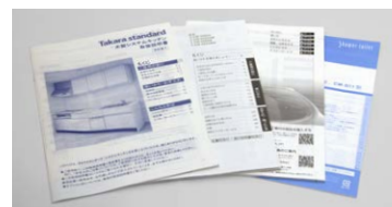
■設備機器取り扱い説明書